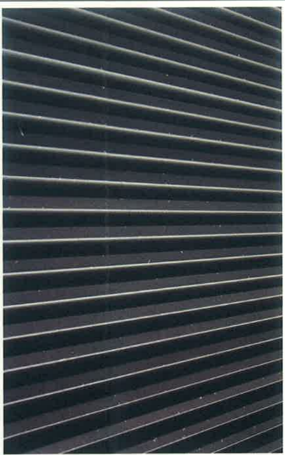
カーポート内部に使ったガルバリウム鋼板外装材に浮き出ている白サビ。雨水がかかからない部分であることに加え、自動車の排気ガスの影響もあり、白サビの原因となる腐食促進物質が堆積しやすいと考えられる

ガルバリウム鋼板は、新日本製鉄㈱の登録商標となっている。通常、ケースも増えてきている。1972年にアメリカ、ピルヒュースチル社が6倍以上の耐久性があるガルバリウム鋼板の3倍の耐久性がある。今回ガルバリウム鋼板の外装材の白サビが見つかったのは6年ほど前に建てたのは初めて商品化されたものでは目録住金属板(ガルバリウム鋼板)が1982年に初めて商品化された。